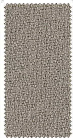
4602 Sandy | Αμμώδες