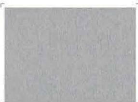
7221 Anodized | Ανοδείωση

TECHNICAL SPECIFICATION: ΤΕΧΝΙΚΑ ΧΑΡΑΚΤΗΡΙΣΤΙΚΑ: