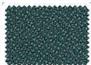
4606 Green | Πράσινο