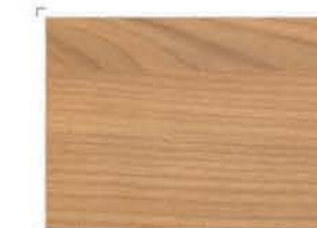
1233 Light Cherry Tree Κερασιά Ανοικίτη