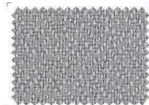
4603 Gray | Γκρι