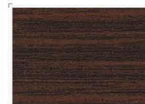
1218 Wenge | Βέγκε