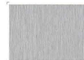
1238 Aluminium | Αλουμίνιο