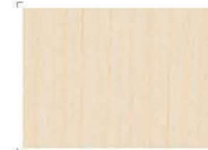
1235 Birch | Σημύδα