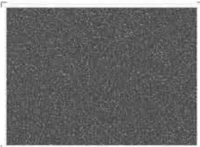
7303 Carbon gray | Γραφίτης