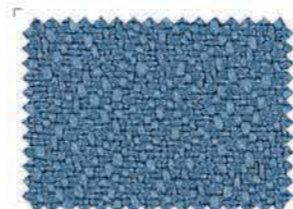
4607 Blue | Μπλε

TECHNICAL SPECIFICATION: ΤΕΧΝΙΚΑ ΧΑΡΑΚΤΗΡΙΣΤΙΚΑ: