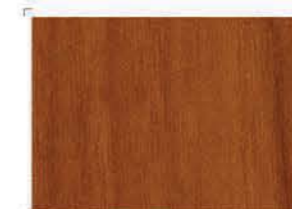
1271 Cherry tree | Κερασιά