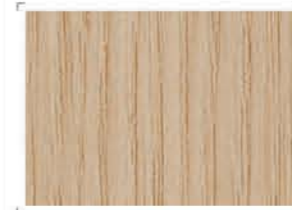
1241 Oak | Δρυς