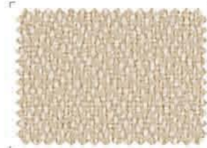
4601 Beige | Μπεζ