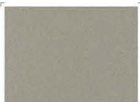
7323 Sandy | Αμμώδες