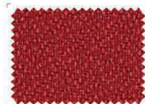
4605 Red | Κόκκινο