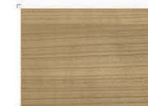
1232 Cherry Tree non varnish Κερασιά αλουστράριστη

TECHNICAL SPECIFICATION: ΤΕΧΝΙΚΑ ΧΑΡΑΚΤΗΡΙΣΤΙΚΑ: